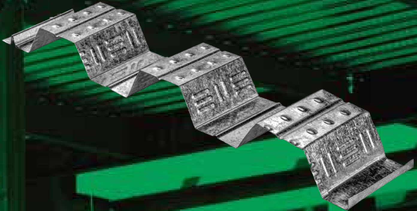
LÁMINA PERFIL DECK (ZD-30.0)